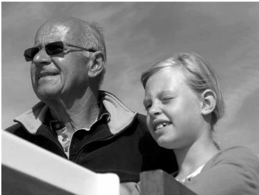
Een trotse opa met zijn kleindochter

03 De volgende dag werd ik wakker en toen gingen we ontbijten. Omdat we vandaag naar schoonhoven gingen. We maakte de touwen los en we gingen. Alleen het eerste water waar we terecht kwamen was een kanaal en dat water was freselijk woest! En vooral alse vracht schepen langs kwamen. Maar wat het ergst is is dat we ongeveer een half uur erop moeten varen. We zijn bijna van het woeste kanaal af. Met de veder kijker kan je er sowieso heel goed kijken. We liggen nu er voor de sluis al ongeveer een kwartier. eindelijk! We zijn van het kanaal af. Want we moesten uiteindelijk er lyk halve us ongeveer een half uur zitten te wachten. voor dat we mee mochten. We zijn uiteindelijk aan gekomen in schoon hoven. En ik was gelijk zwemmen. Daarna gingen we Naar de bar en we hadden 2 bakjes fruit en twee bakjes bittballen.