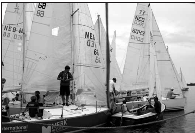
Zelfs dringen NA de start

Let goed op de mail (als we je mailadres nog niet hebben geef het dan even door: adenherder@denherder.nl of he-scheepmaker@hetnet.nl ) en de WV Flevo site. Hier vind je in de loop van 2013 weer alle informatie.