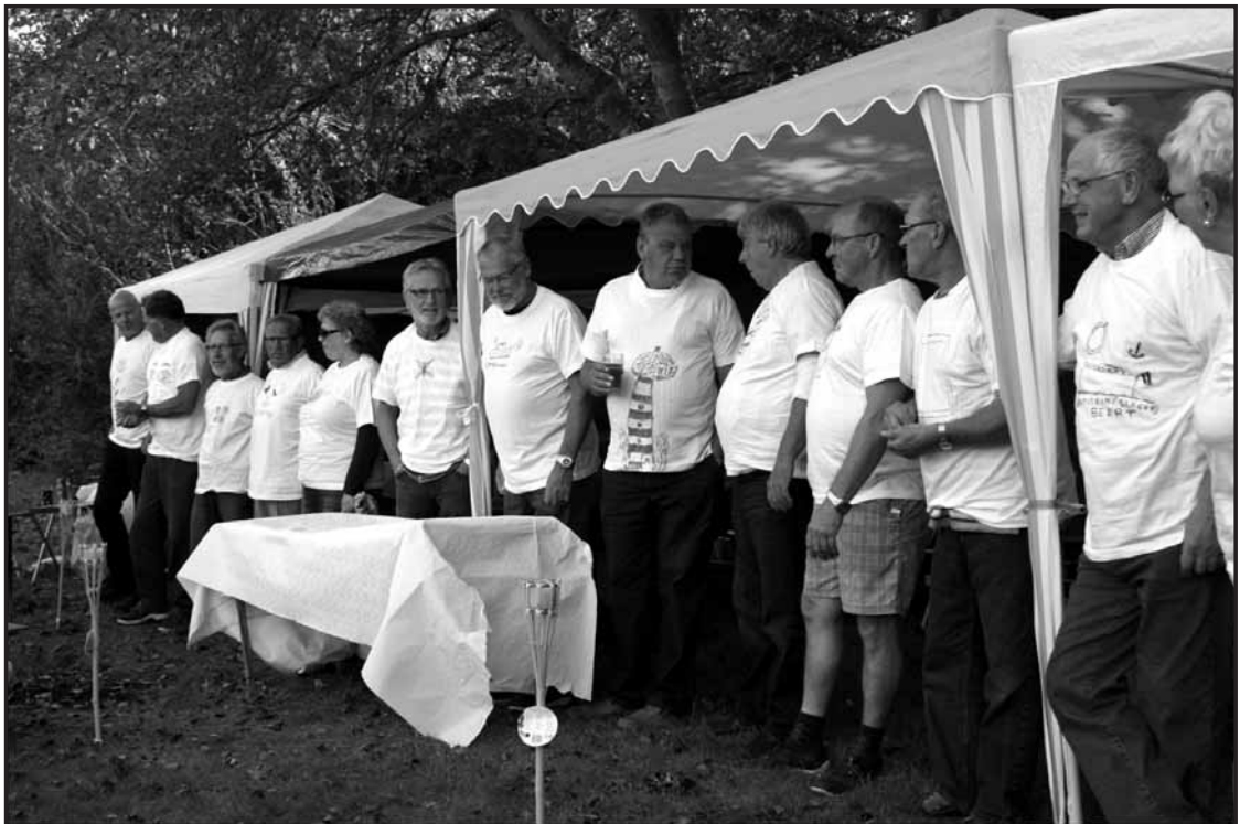
Een moeilijke keuze...

jury betoogde dat het heel moeilijk was geweest om de beslissingen te nemen omdat de kwaliteit zo ontzettend hoog lag. Uiteindelijk waren ze toch unaniem tot een besluit gekomen dat de eerste prijs was gewonnen door de bemanning van de "Changer", de tweede prijs door de bemanning van de "Dobber" en de derde prijs door de bemanning van de "Osprey". Naast de eeuwige roem voor de winnaars waren er ook nog prachtige prijzen beschikbaar gesteld door de organisatie.